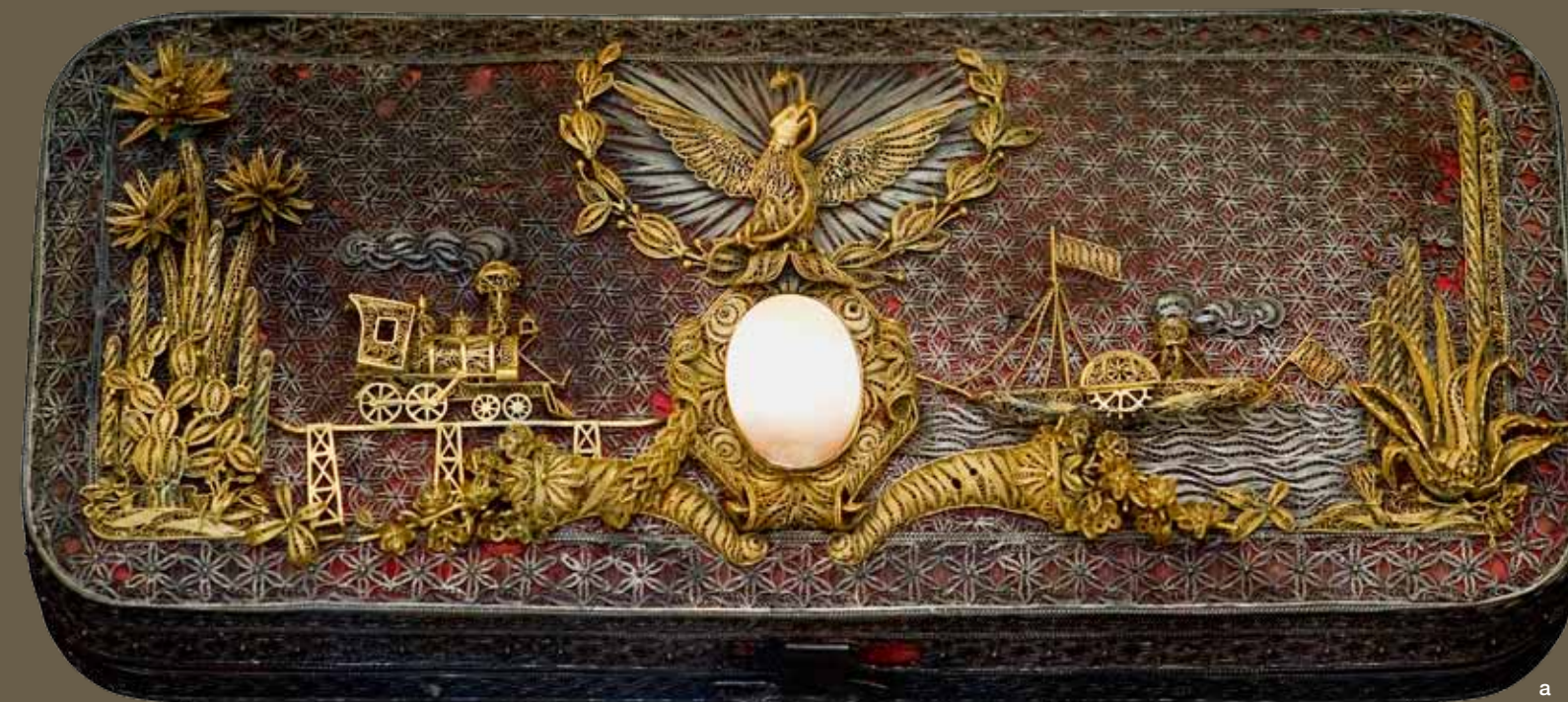
El águila real en distintas aplicaciones: a) Caja para puros decorada de filigrana de oro y plata que celebra la conclusión de los trabajos del ferrocarril que unió a la ciudad de México con el puerto de Veracruz, 1873. b) Bolsa de seda blanca, bordada con chaquira y un broche de latón; en una de sus caras aparece el escudo nacional y en la otra el gorro frigio, ca. 1845. c) Cartuchera: trabajo mexicano en cuero con aplicaciones de cobre, latón y madera, ca. 1860. d) Molde en metal del Escudo Nacional, siglo XX. e) Medalla conmemorativa con la imagen de Guadalupe Victoria en el anverso, siglo XIX. f) Sello de la Prefectura y Comandancia de Xochimilco, siglo XIX.