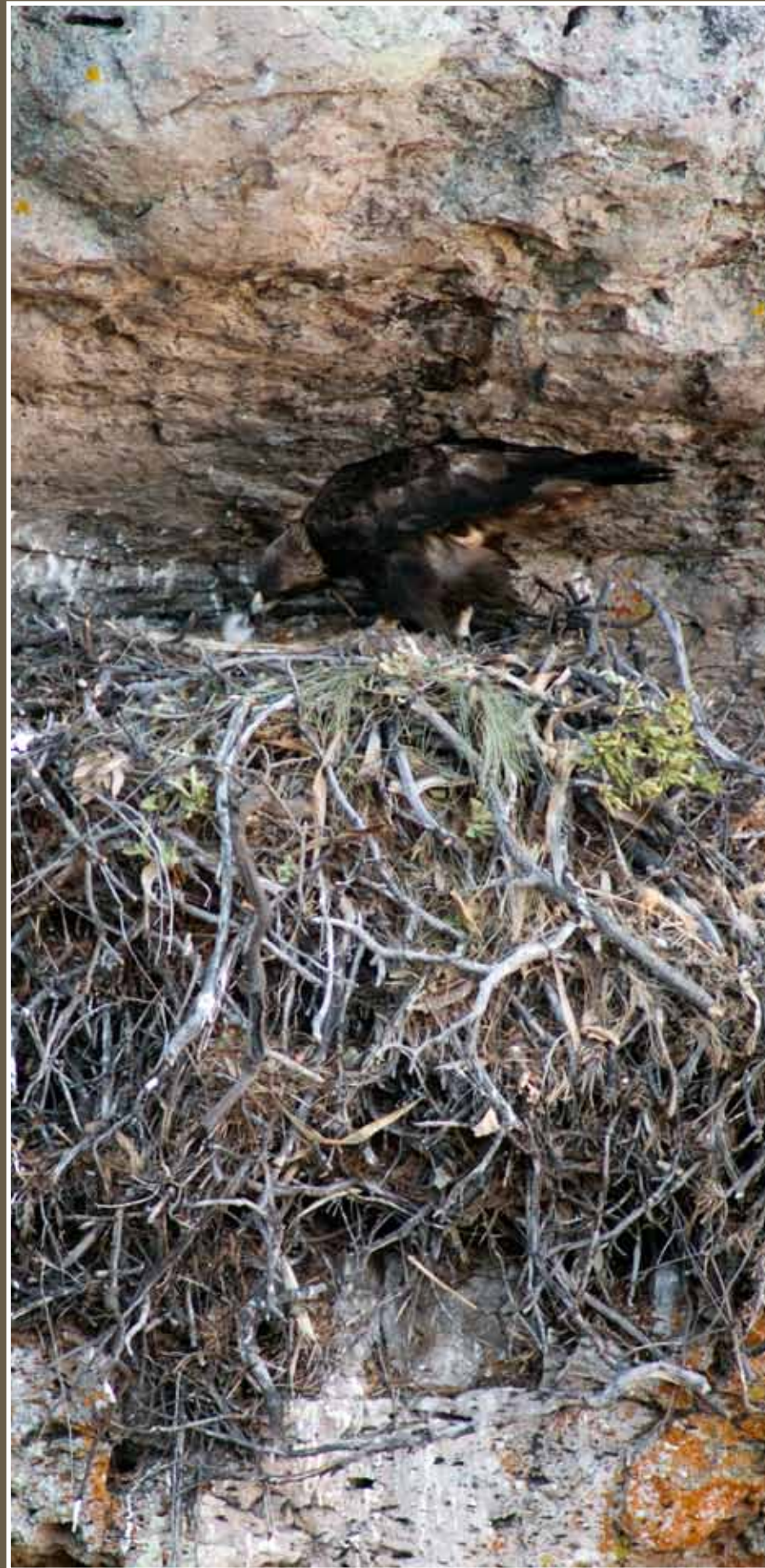
A fines de marzo nacen los polluelos. En un principio están recubiertos de un plumón corto, escaso y grisáceo, pero a la semana lo reemplazan por uno blanco y más tupido. Durante su primer mes de vida aún no son capaces de despedazar la comida y dependen totalmente de su madre que los alimenta en el pico uno a la vez y con sumo cuidado.